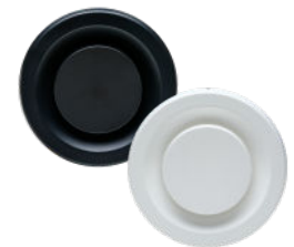
MKL-2 100/125 afzuigventiel art.nr. 23120005 (wit) art.nr. 23120007 (zwart)