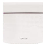
CO 2 ruimtesensor 15RF art.nr. 21800040