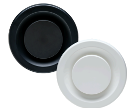
MKL-2 100/125 afzuigventiel art.nr. 23120005 (wit) / 23120007 (zwart)