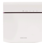
CO 2 bedieningssensor 15RF art.nr. 21800045