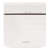
CO 2 bedieningssensor 15RF art.nr. 21800045