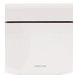
CO 2 ruimtesensor 15RF art.nr. 21800040