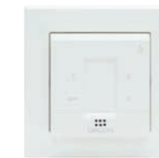
Vochtsensor 15RF art.nr 21800030CV