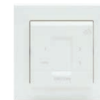
CO 2 bedieningssensor inbouw 15RF art.nr 21800050