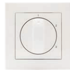
CV-3 schakelaar art.nr 28000000 (inbouw) art.nr 28000005 (opbouw)