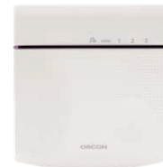
CO 2 bedieningssensor 15RF art.nr 21800045