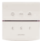
Afstandsbediening 15RF art.nr 21800000