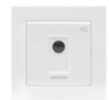
Bewegingssensor 15RF art.nr 21800080