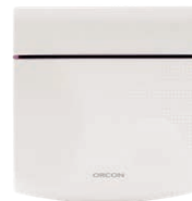
CO 2 ruimtesensor 15RF art.nr 21800040