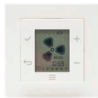
HRC display 15RF art.nr 21800060